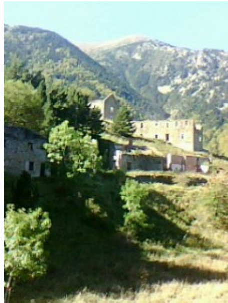
Bivouac sous tipi